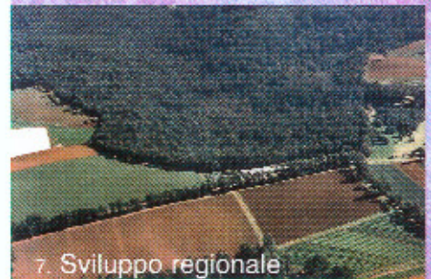
7. Sviluppo regionale