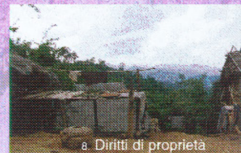
8. Diritti di proprietà