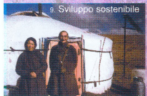
9. Sviluppo sostenibile