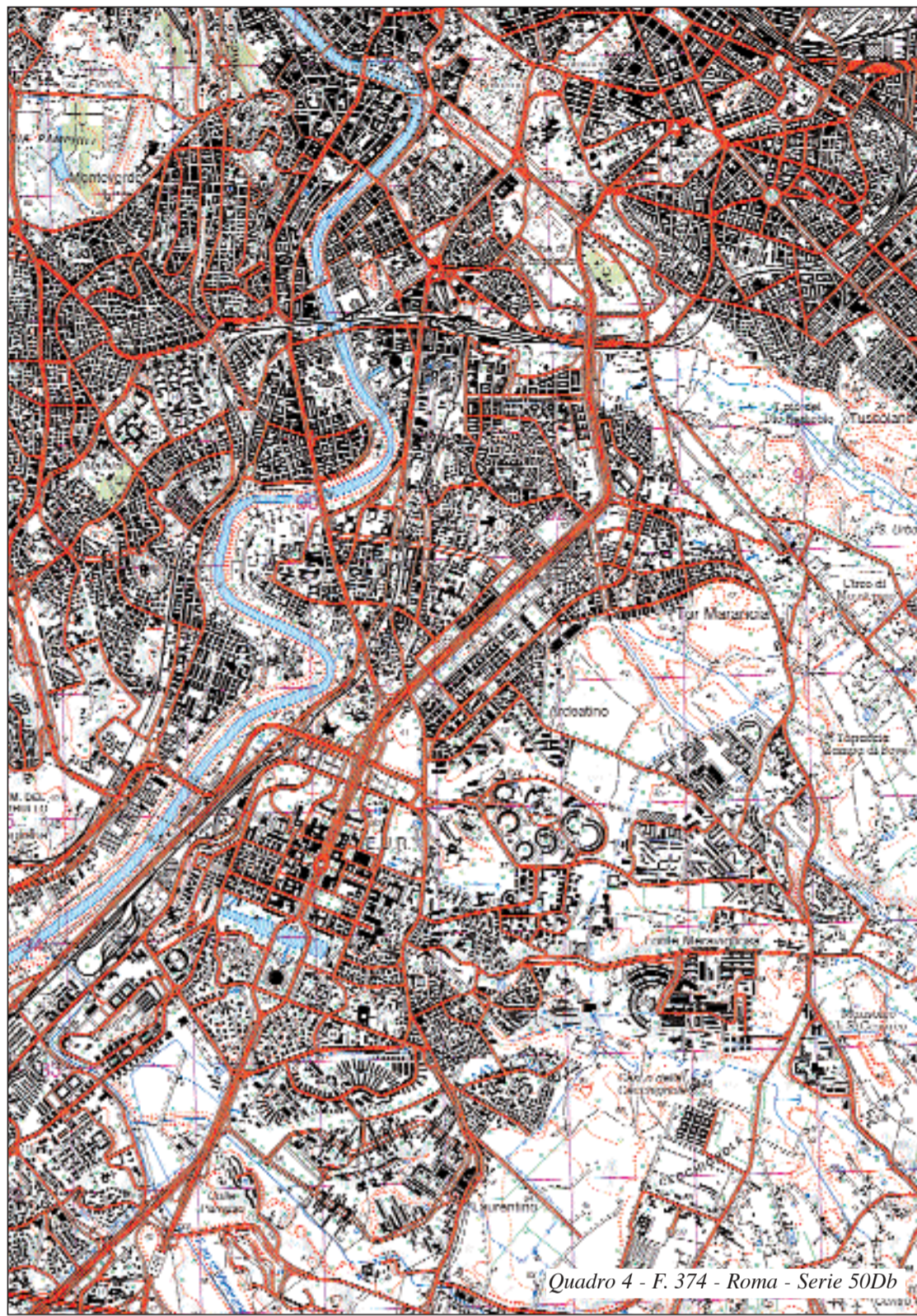
Quadro 4 - F. 374 - Roma - Serie 50Db

A Roma, a partire dalla fine del XIX secolo, è iniziato un fenomeno di segregazione socio-spaziale che si è poi sviluppato per tutto il Novecento. Con l'espandersi della città cresceva il valore di rendita in molti settori centrali e questo comportava una selezione sociale sempre più netta. Le case popolari erano respinte verso le aree periferiche, svilite dalle condizioni ambientali,