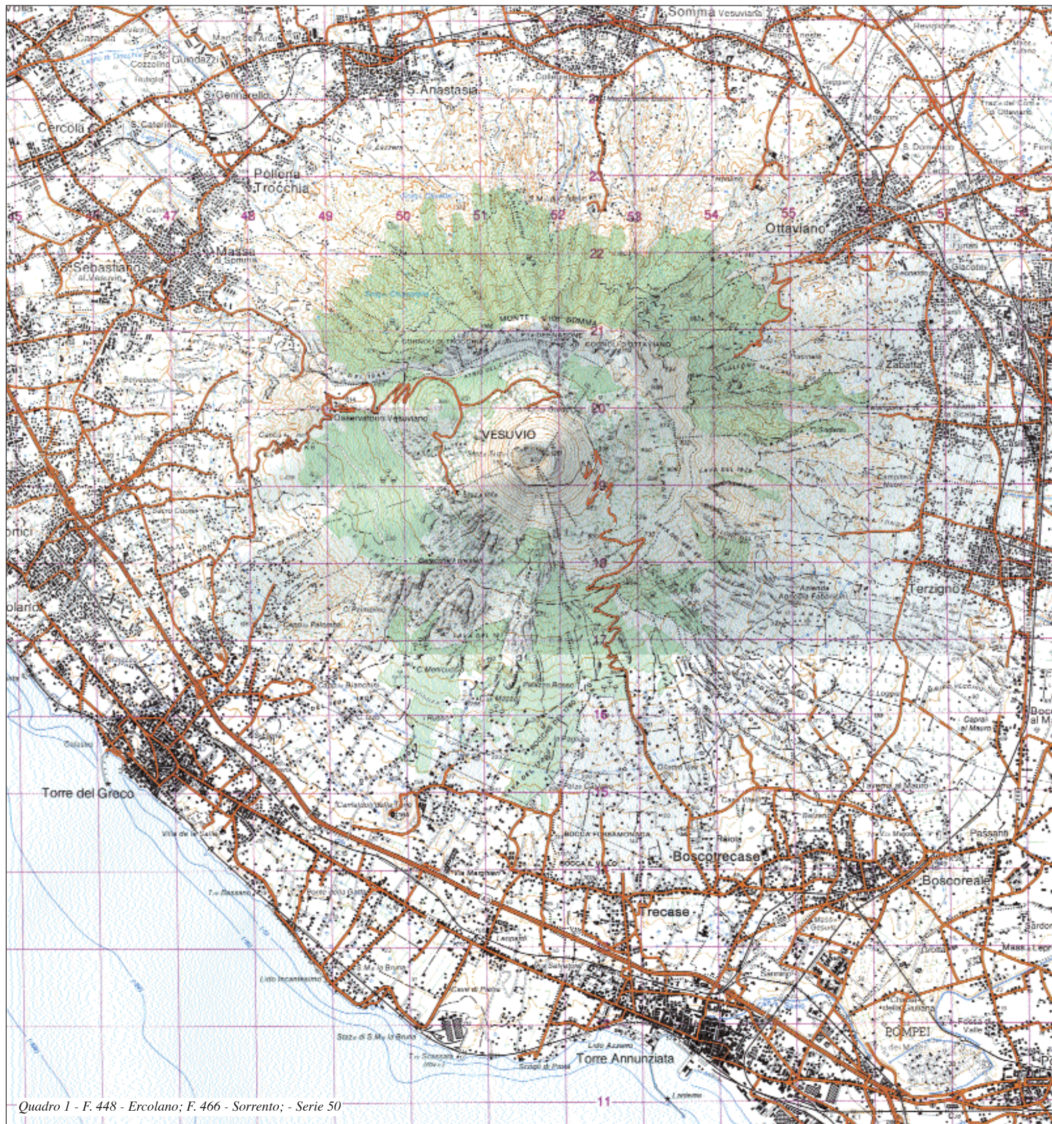
Quadro 1 - F. 448 - Ercolano; F. 466 - Sorrento; - Serie 50

1131 m con la punta del Nasone) – reliquia di un vulcano spento – e l'attuale, attivo cono craterico (o «Gran Cono») del Vesuvio, che occupa quasi interamente, mascherandola, la porzione occidentale e meridionale della depressione calderica. Nel quadro 2 la distinzione morfologica è più che evidente e si coglie bene, se si osserva la figura con speciali «occhialini» che ne permettono la visione tridimensionale. Somma e Vesuvio sono separati da una depressione semilunata (o valle intracalderica), la valle del Gigante, aperta alle due estremità. Forme simili, anche per dimensioni, sono documentate pure in altre tavole dell' Atlante dedicate alla morfologia vulcanica (cfr. tavola 72. «Calderi e crateri»).