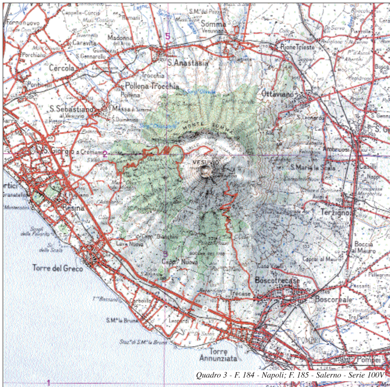
Quadro 3 - F. 184 - Napoli; F. 185 - Salerno - Serie 100V

Altre forme vulcaniche si rilevano intorno al «Gran Cono», di cui costi-