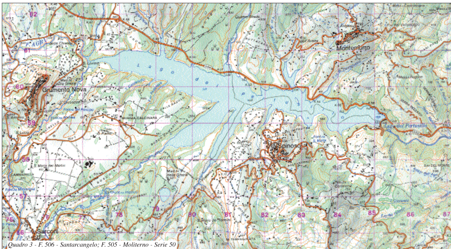
Quadro 3 - F. 506 - Santarcangelo; F. 505 - Moliterno - Serie 50

senso che dopo l'utilizzazione in una centrale elettrica l'acqua viene nuovamente raccolta in un ulteriore invaso ed inviata in una successiva centrale, spesso con l'aggiunta di altra acqua intercettata a monte.