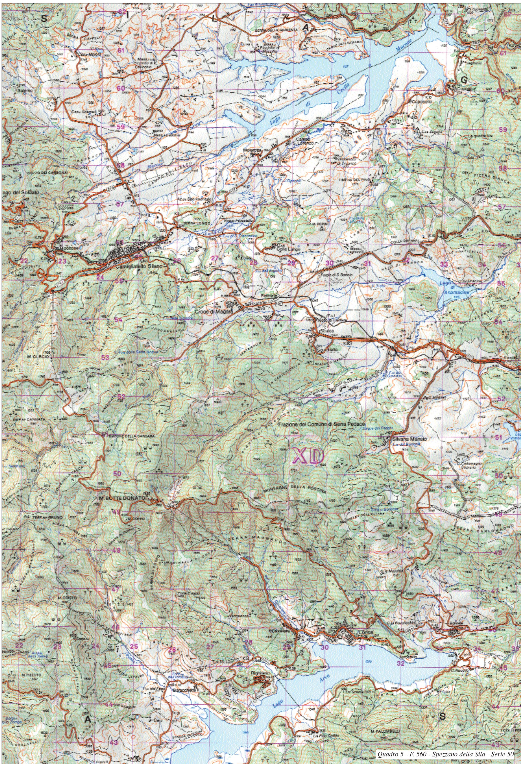
Quadro 5 - F. 560 - Spezzano della Sila - Serie 50