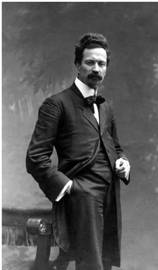
Cesare Battisti a Milano nel 1915.

Battisti era stato, fra gli allievi di Giovanni Marinelli, il più attento a cogliere le nuove correnti di pensiero che nel campo della geografia percorrevano l'Europa sul finire del secolo XIX e insieme ribadire la continuità con la tradizione della quale Antonio Gazzoletti e prima di lui Clementino Vannetti si erano fatti interpreti; iscritto contemporaneamente a più Università, passando da Vienna a Graz, da Torino a Firenze, sottoponeva alla continua verifica delle più moderne teorie i suoi studi empirici sul Trentino.