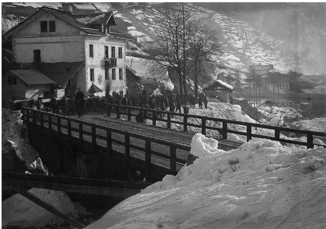
Caoria, il ponte, confine italo-austriaco durante la Prima Guerra Mondiale.

Le mie convinzioni riguardo all'annessione di quella parte del Tirolo tedesco che va da Bolzano al Brennero sono divise da pochi. Sono forse le convinzioni di un solitario. Ma so che le condividono alcuni miei amici tridentini che erano fratelli nella fede e nell'azione di Cesare Battisti. D'altronde è vero che se il Tirolo al di qua del Brennero fa parte geograficamente del Trentino, la divisione di razza, di psiche, di costumi fra le due regioni non potrebbe essere più profonda. [...] Noi dobbiamo domandarci se per avere la linea topograficamente perfetta (del Brennero) quando la buona (a Salorno) coincide con la linea etnica, converrebbe all'Italia deporre entro i propri confini il germe dell'irredentismo tedesco.