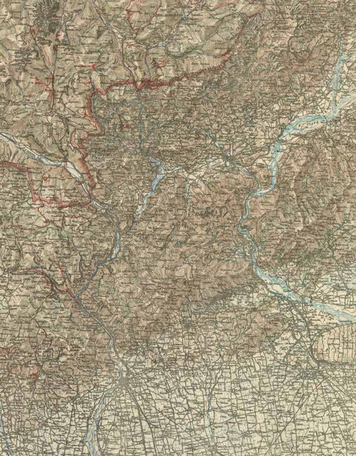
Particolare ridotto della Carta del teatro di guerra italo-austriaca – Carta degli Altopiani, scala 1:100000, 89x98 cm, 1917 (Biblioteca "Attilio Mori", IGM, inv. n. 3104).