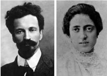
Cesare Battisti e la moglie Ernesta Bittanti.

Quel «Battisti rapidamente decide» rinchiude in sé, come ebbe modo di sottolineare lo storico Paolo Spriano, insieme il dramma personale di Battisti e quello di un'intera epoca storica. Siamo qui, al prestigioso Istituto Geografico Militare, a ricordare il geografo di Trento, per il quale così la vedova definì il profilo nella nota preliminare all'edizione nazionale delle opere geografiche, stesa ancora nel luglio del 1921, ben due anni prima della pubblicazione: